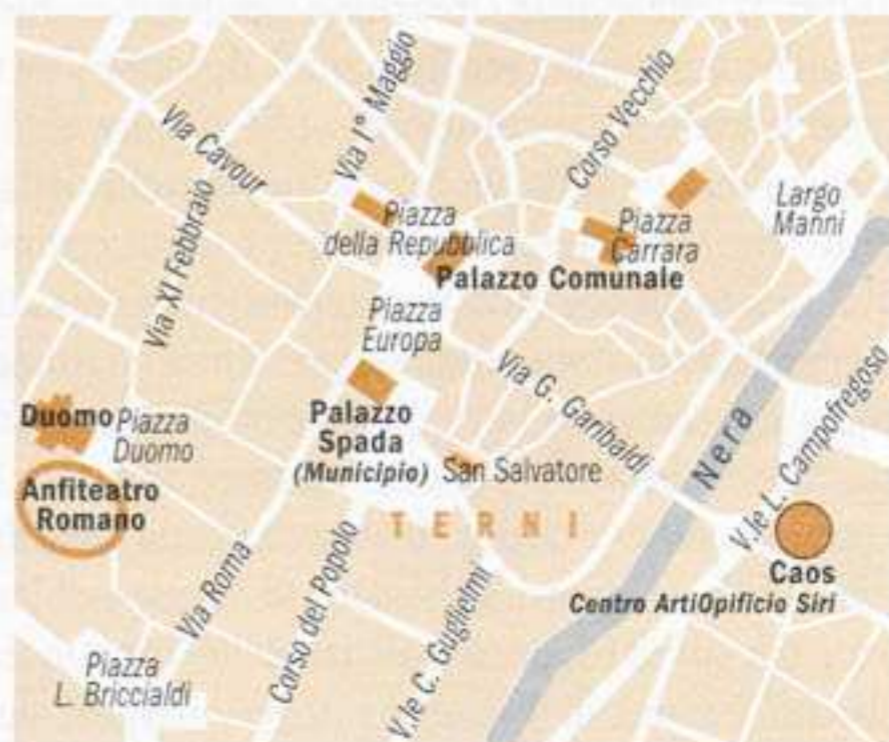
In alto: il "Centro Arti Opificio Siri"

TERNI È BELLISSIMA", recita un manifesto nella cittadina umbra che si reinventa, si rivitalizza e rinasce a partire dalla cultura. Vecchie fabbriche dismesse sono state recuperate come nuovi spazi per l'arte contemporanea, sono nati caffè letterari con tanto di libreria, ristorante, enoteca e spazio per reading di poesia, al posto delle vecchie botteghe spuntano gallerie d'arte, nell'antico Duomo trovano temporaneamente spazio installazioni e sculture di artisti contemporanei e nell'ospedale sorge un centro europeo all'avanguardia per la ricerca sulle cellule staminali, l'unico ▶